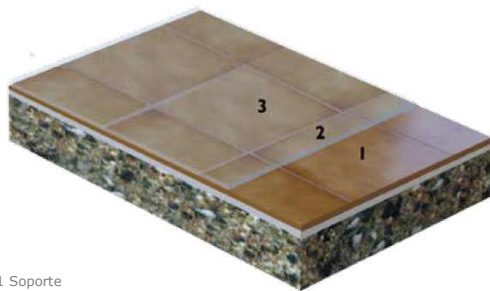
1 Soporte 2 Imprimitación 3 TechmoPol PROTEC 60 + TechmoPol ADITIVO ANTI SLIP

El SISTEMA TECHMOPOL ANTIDESLIZANTE Transparente , es un revestimiento de altas prestaciones a base de poliuretano Alifático mono componente transparente o coloreado, que reacciona con la humedad ambiental, dando lugar a recubrimientos duros y flexibles a la vez, continuos y con altas resistencias a la abrasión y a los agentes químicos externos, constituye una protección superficial excelente para pavimentos sometidos a una intensa acción de desgaste y al ser antideslizante tiene una gran variedad de aplicaciones. Este sistema antideslizante se compone de la siguiente estructura.